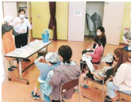
▲山形新聞2022年5月11日 こども達に栽培手順を説明する営農販売部長