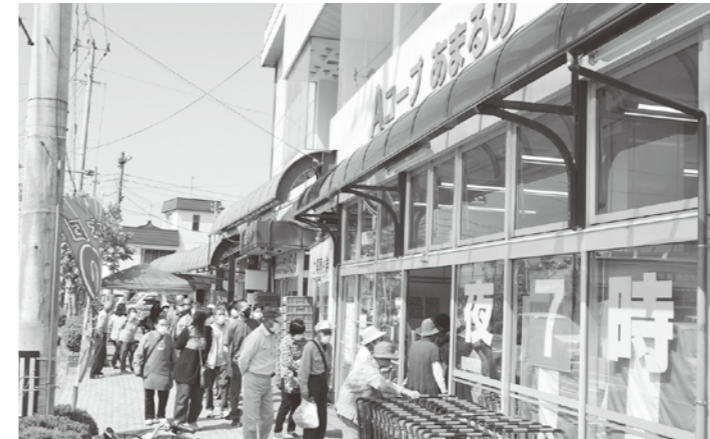
▲開店前から長蛇の行列でした!

5月29日、生活館にて豊作を願い、さなぶりセールを行いました。生鮮商品を中心にお客様も大賑わいで、2,000人を超える方からご利用いただきました。また、今月の6月12日(日)は総会記念セールを行います。2,000円以上お買い上げの方には、レシートご提示で先着1,500名の方に紅白餅を進呈いたします。豊富な商品をご準備いたしますので、是非この機会にご利用よろしくお願います!