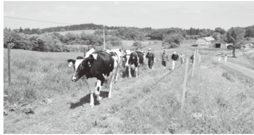
▲おいしい牧草を食べて元気に育ってね！

鶴岡市羽黒の月山高原牧場で5月17日に和牛、5月24日に乳牛の入牧式が行われ、令和4年度の放牧事業がスタートしました。庄内全域から2日間にもわたり、乳牛合わせで178頭、当農協管内からも乳牛4頭が入牧しました。 10月下旬の下牧まで栄養たっぷりの牧草を食べて、病気や怪我無く帰ってきてほしいですね。 また、妊娠予定の牛もいるので下牧後は元気な赤ちゃんを出産できると嬉しいですね。