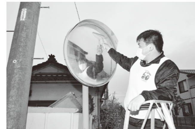
▲管内約150基のカーブミラーを綺麗に磨きました。

4月23日(土)、JAあまらめ役員によるカーブミラークリーン作戦が朝7時より実施されました。合併50周年の事業として始まり、今年度で5回目となります。当日は雨が降り風もあって肌寒い中、役員37名で管内集落のカーブミラー約150基を磨きました。これから梅雨に入り、雨が強い日は視界が悪くなります。一時停止のところではきちんと止まり、スピードを出しすぎないように心がけていきましょう。