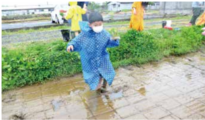
▲泥だらけになりながら頑張りました！