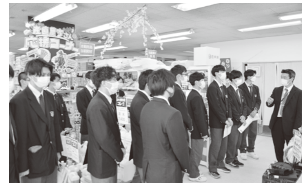
▲資材館の購買状況について説明を行いました。

4月27日、庄内総合高校の生徒が当農協に企業訪問に訪れました。企画管理部長が生徒たちに、生活館や資材館の事業状況・信用共済部の業務内容などを説明しました。資材館では、野菜苗の繁忙期で様々な種類の野菜苗を見る生徒たちが多くいました。生活館では、産直商品の紹介をした際、種類が豊富な産直コーナーに驚いた様子でした。