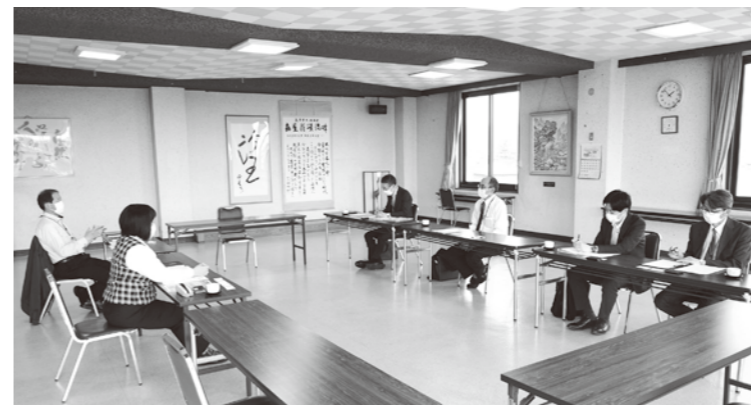
▲交付金や協力金について話し合い要望しました。

5月12日に東北農政局山形県拠点より3名の職員が来組し、原油価格高騰・物価高騰による肥料や飼料への国の対策について説明を受けました。また、令和3年産米の収入減少影響緩和交付金（ナラシ対策）の申請の簡素化や、農地の受委託に伴った、機構集積協力金活用への緩和について要望しました。