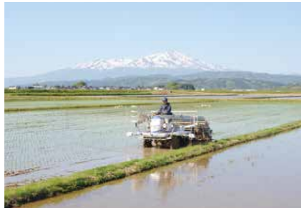
▲鳥海山を背景に絶好の田植え日和でした（廿六木）

5月下旬で管内の田植え作業もほぼ完了し、これからは水田での稲の管理となります。 5月は天候が良好で、田植え作業も順調に終了しました。変わって6月は天候不良が予想されます。強風などが続く場合は、保温的水管理で稲体を保護しましょう。ワキが発生する場合もありますので、こまめな水管理で対応しましょう。