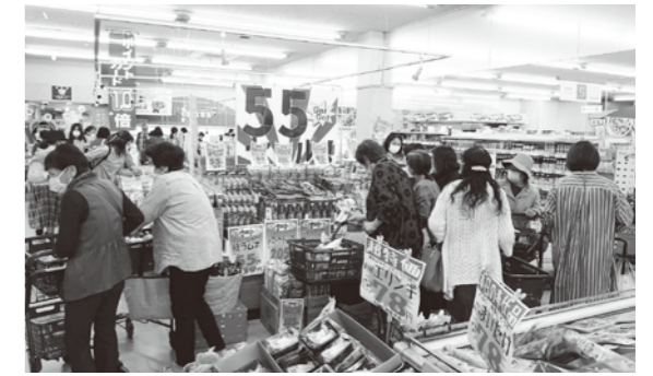
▲Aコープあまらめ55周年記念で55セールを開催!

5月5日、生活館にてAコープあまらめ55周年を記念して55セールを開催しました。開店前から多くのお客様で賑わい、店舗内では55周年にちなんで55円均一の商品を多数陳列しました。お買い物に来たお客様からは「工夫されたセールで面白いと思う。これからもこのようなセールを企画してほしい」との声がありました。