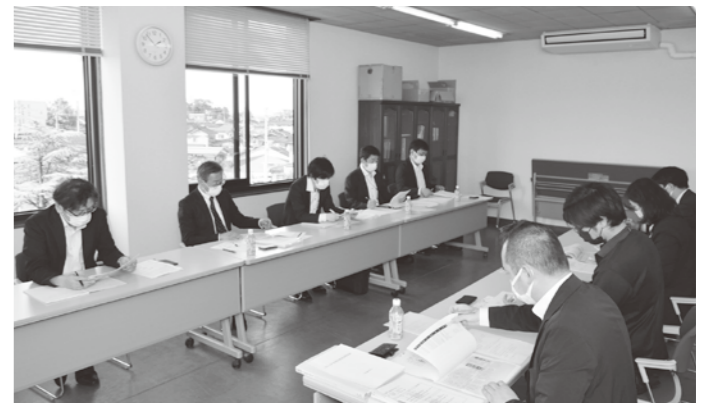
▲各取引先より指定産地訪問があり、充実した会議となりました。

5月12日に日本生活協同組合連合会（日本生協連）の指定産地訪問があり、日本生協連の商品本部、担当卸の木徳神糧株式会社、津田物産株式会社との各取引先より8名が来組しました。日本生協連には当農協余目型はえぬきの取り引きがあります。今回の訪問は年2回行われる指定産地訪問の1回目となり、令和3年産米の販売状況、各検査状況、原料玄米品質状況等の各報告が行われました。話し合いの中で生協版GAPへの取り組みやSDGs対応について協議されました。国の事業「みどりの食料システム戦略」に向けた、当農協の令和4年度の試験内容に興味を示し、今後の販売活動に生かしたいと思えます。