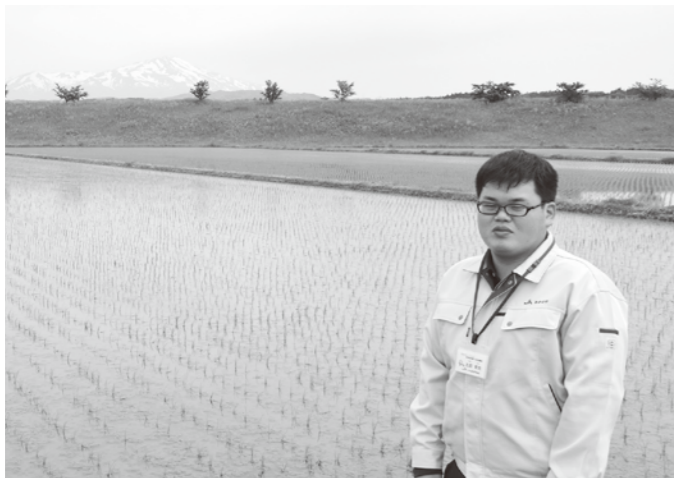
▲日々農業について学んでいます。お気軽に生産指導係までご連絡ください。