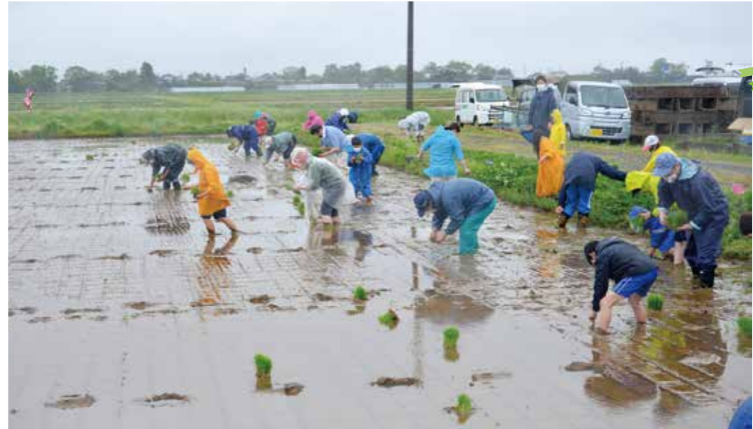
▲3年ぶりの田植え体験！上手に植えられたかな？

5月14日、3年ぶりに生協共立社と体験農業交流会の田植え作業が行われました。 今年で第34回目となる同交流会は農作業体験を通して生産者と消費者との交流、消費者から食と農への理解を深めてもらうことを目的として毎年行っています。